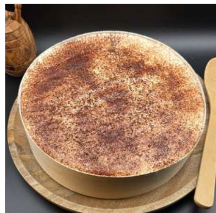
Tiramisù traditionnel de Trévisè au café 35€ HT