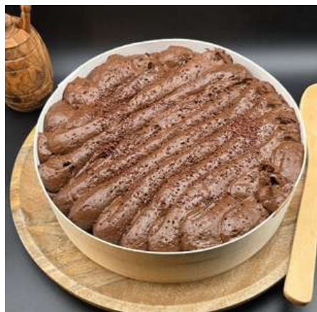
Mousse au chocolat à l'ancienne 35€ HT