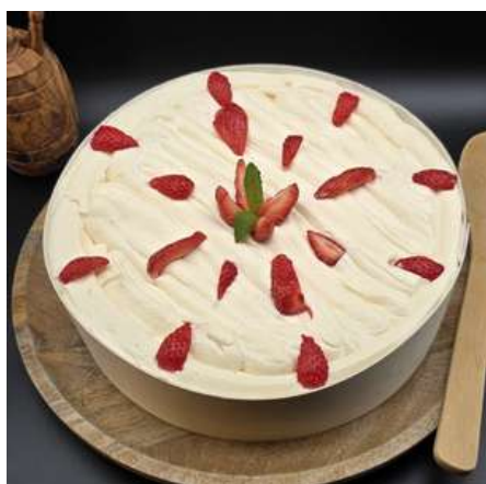
Tiramisù della nonna aux fraises & fruits rouges 35€ HT