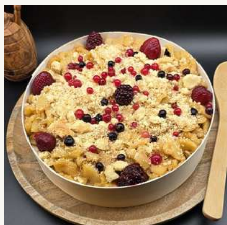
Crumble aux pommes caramélisées & fruits rouges 35€ HT