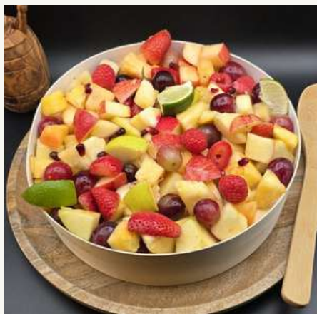
Fruits frais coupés en direct du marché 35€ HT